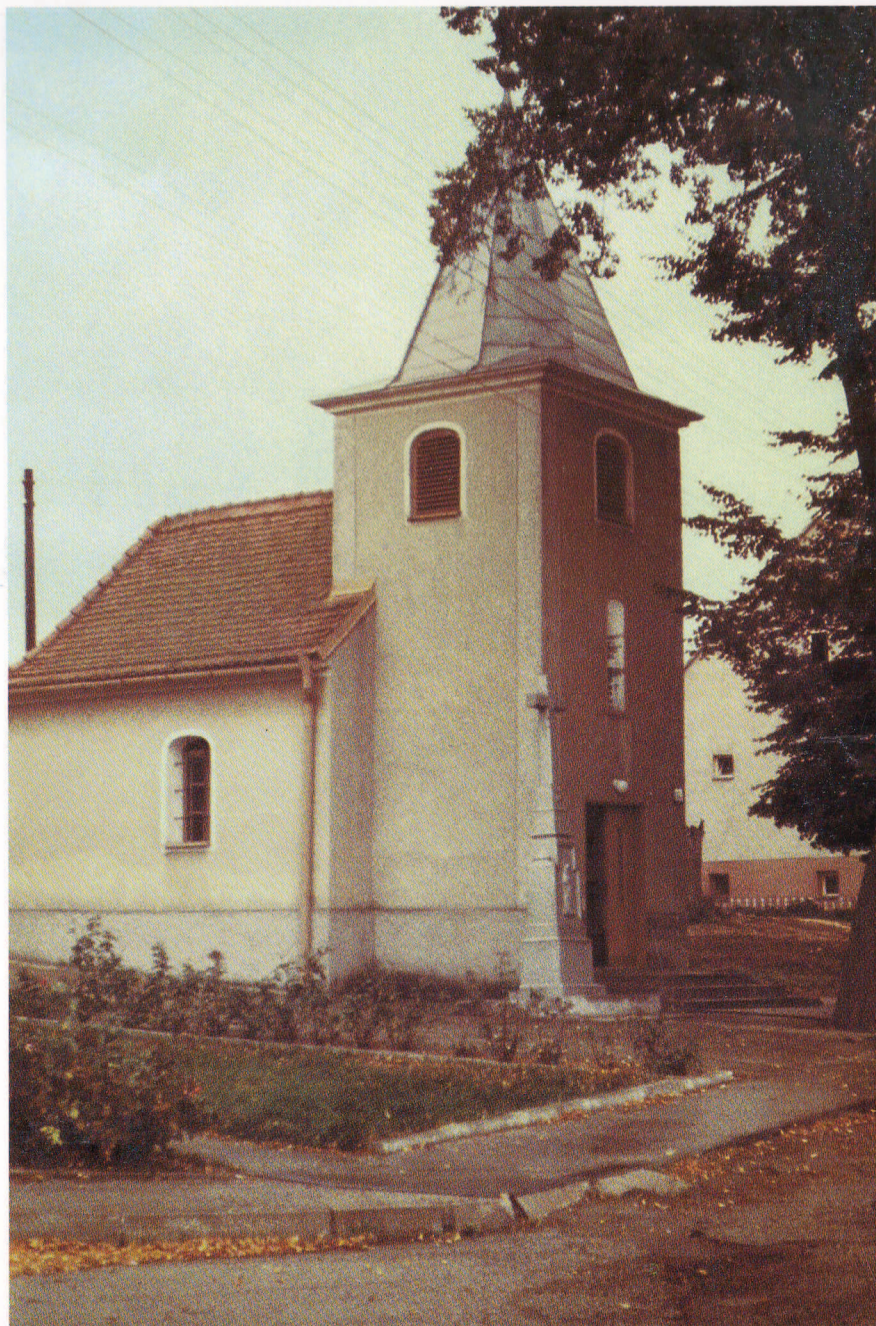
Kaplnka Panny Márie z r. 1832