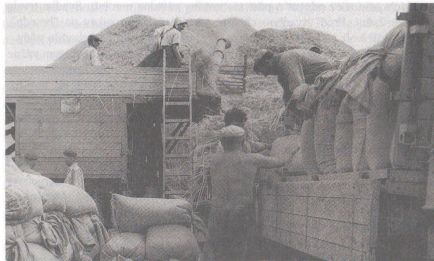
Mlatba na JRD začiatkom 60 - tych rokov

Po dožinkách, ktoré bývali koncom augusta, sa všetko začalo chystať na hody. Tieto bývali po Panne Márii /12. sept./. Bola to oslava zosvätenia kostola /kaplnky/. Tento deň bol veľmi očakávaný najmä mládežou, lebo hneď po nešpore, začínala vonku, na dvore šenku, veľká hodová zábava, večer často prerušovaná šarvátkami medzi chlapcami jednotlivých dedín. Tradičným hodovým jedlom je dodnes husacina. Starí ľudia sa pamätajú, že bývali v Rybkách ešte jedny hody /vraj na Martina?/.