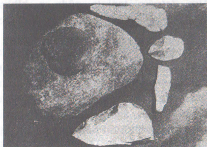
Kovadlinka s otláčacím kamienkom a paleolitickými nástrojmi

Doteraz najstarším dôkazom o pobyte človeka na území chotára Rybiek je nález patinovaných kamenných nástrojov, pochádzajúcich z paleolitu - staršej doby kamennej. Boli to príslušníci tzv. gravettienskej kultúry /25 - 15 000 rokov pred n. l./ Od pravekého človeka sa líšili odlišnými tvarmi a novými druhmi nástrojov. Najbohatší nález z gravettien v okolí Senice je z nášho chotára. Tvoria ho kovadlinka z tvrdej kremitej horniny, otlákač a niekoľko do biela patinovaných štiepaných nástrojov, ktoré ležali v tesnej blízkosti. Celý nález tvorí akúsi dielnu, v ktorej si praveký lovec vyrábala potrebné nástroje.