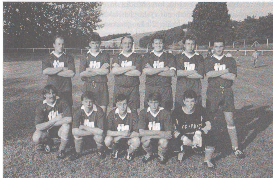
Vítaz III. triedy východ v súťaž. roč. 1993/94: FC Družstevník Rybky