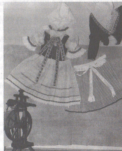
Kroj z Rybiek

Oblasť Senice bola prevažne poľnohospodárska. Spôsob života bol podriadený ročnému cyklu poľnohospodárskych prác. Existovali výrazné odlišnosti medzi spôsobom života od jari do jesene a cez zimu. Duchovné potreby vyplňal kostol, len čiastočne v zimnom období škola a ustálené folklórne a sviatočné obrady. To určovalo systém hodnôt a spôsob života jednotlivcov. Ľudia našej obce mali radi prácu. Úzkostlivý vzťah k majetku vyplýval zo skromnosti a z pripútanosti k pôde.