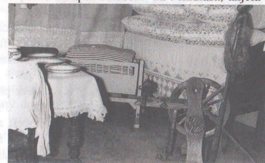
Zariadenie sediackej izby

Na Luciu sa ľudia chránili proti zlým silám