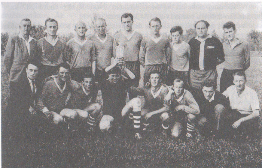
Futbalové mužstvo v r. 1966