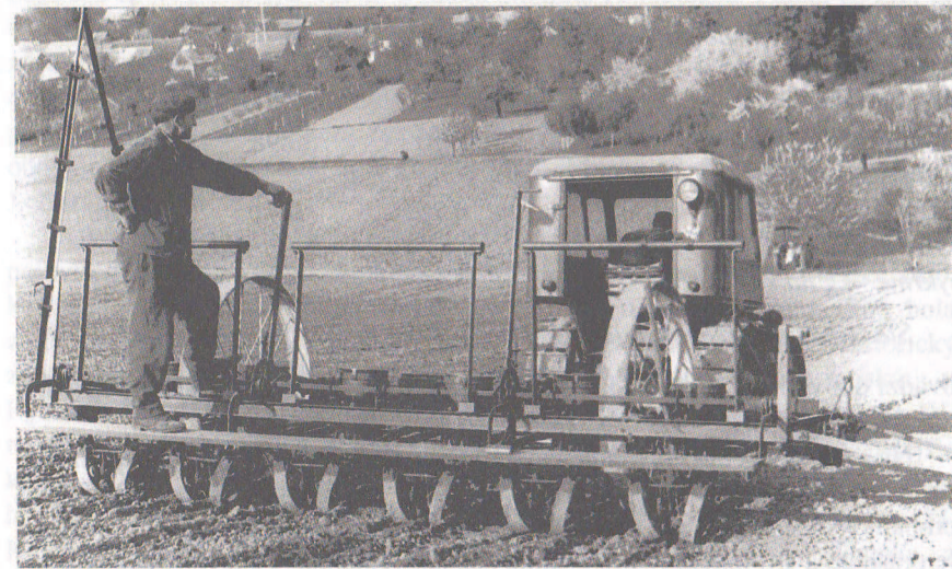
Jar v rybeckom chotári