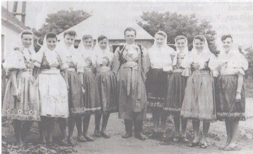
Mládež na dožinkách

Žatva v nás vzbudzuje predstavu úmornej práce, ale aj odmenu za všetku doteraz vykonanú námahu na poli. Kedysi musel roľník obilie zožať ručne za pomoci rodiny. Chlapi kosili, ženy hrstovali a dávali obilie do snopov. Tieto sa zväzovali provrislami a uťahovali /knutlovali/. Deti spravidla znášali snopy na hromadu, kde ich dospelí ukladali do krížov /kúpek/. Obilie sa takto sušilo celé týždne. Preschnuté obilie sa z poľa zväžalo do stodôl a do stohov. Potom ho bolo treba vymlátiť. Do polovice minulého storočia sa mlátilo ručne - cepami. Mlátilo sa na tvrdo udupanej zemi v strede stodoly /na muatovni/. Neskôr sa mlátilo pomocou geplov. Nakoniec sa muselo vymlátene obilie vyčistiť pomocou síta, resp. valacha. Konečne koncom 19. stor. prišli mláťačky, ktoré obsluhovalo 12-20 ľudí. Na žatvu sa tešili nielen hospodári, ale hlavne deti. Na prestávky pri robote /na svačinu/ sa totiž dávalo parádne pohostenie /šišky, makovníky, biela káva a čaj/. Žatva sa končievala prinesením dožinkového venca richtárovi. V období združstevnenia tradícia dožiniek dostala úplne inú formu. Boli spojené s bohatou hosťinou, kultúrnym programom, ktorý pripravila mládež a tanečnou zábavou.