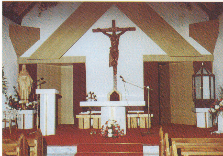
Interiér kostola Panny Márie