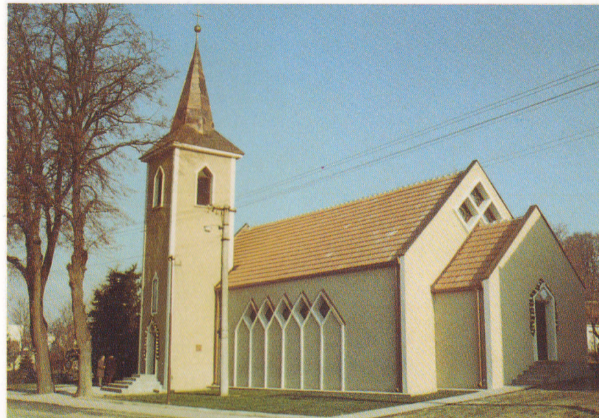
Kostol Panny Márie vysvätený 19.11.1989